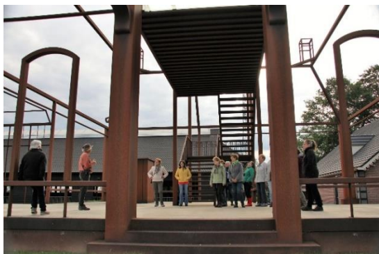
De foto's spreken voor zich!